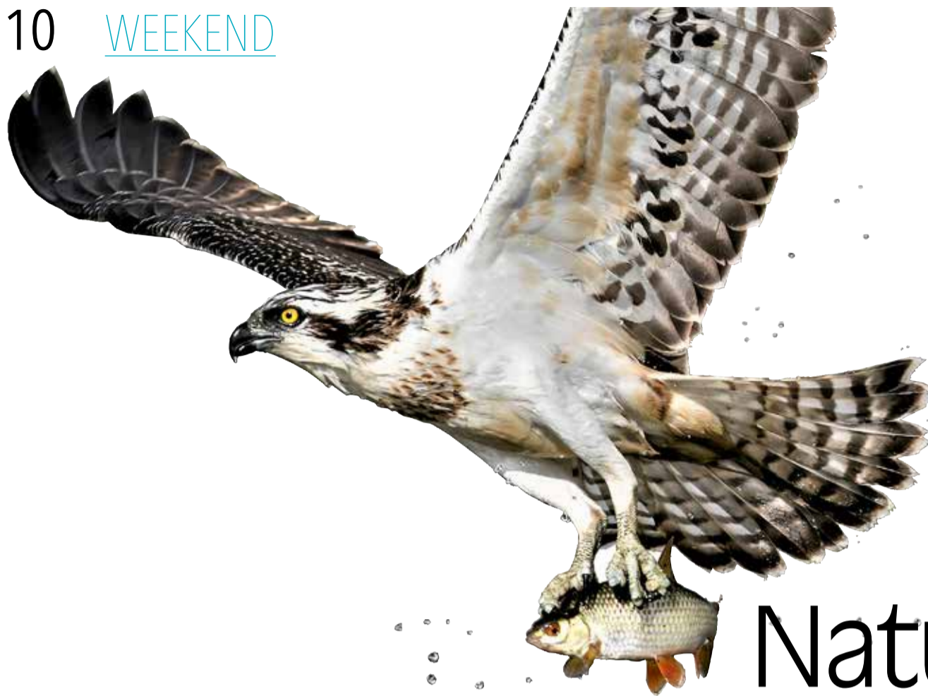
Fiskeørn med en skalle foreviget ved Sønder Lem Vig.