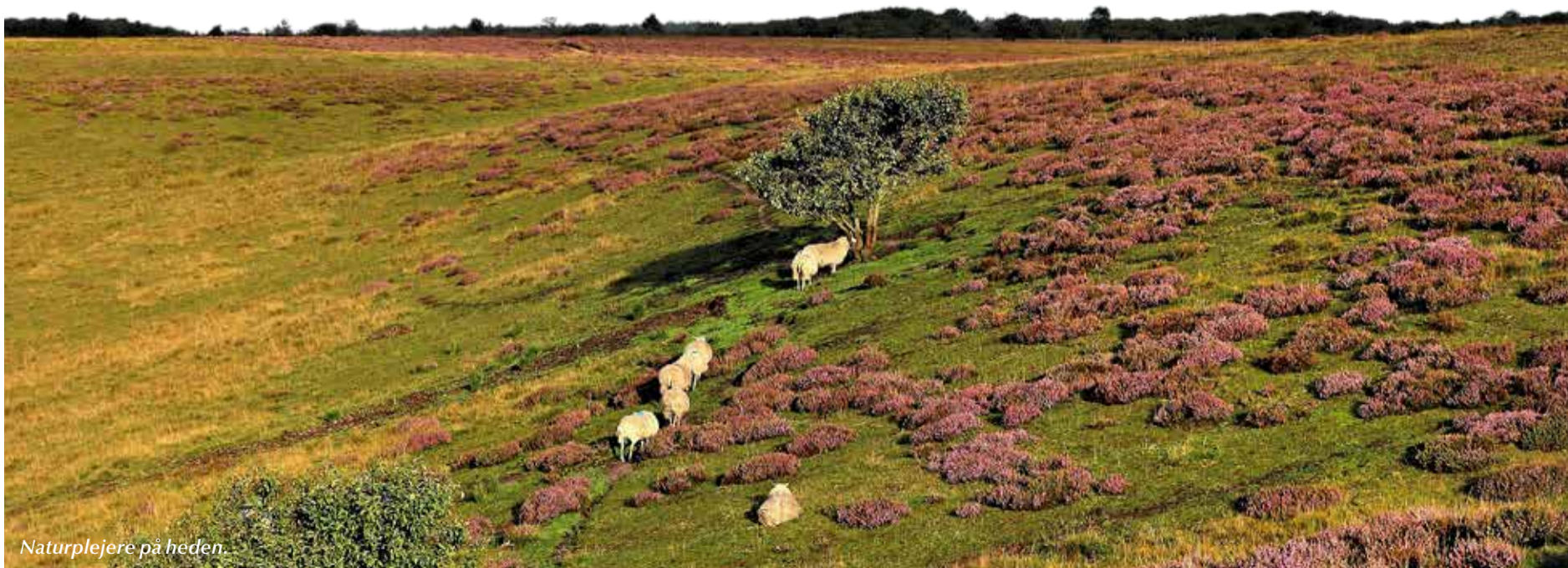
Naturplejere på heden.